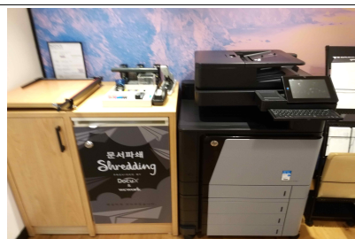
공용 프린트 스테이션