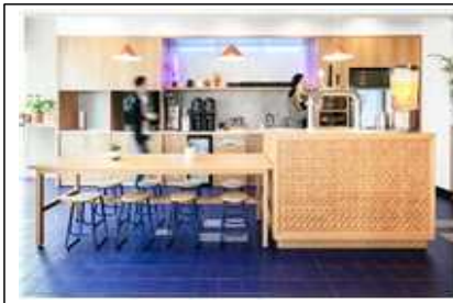
위워크 풀 서비스 팬트리