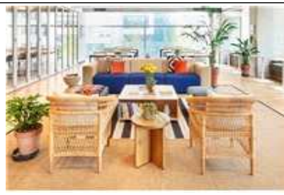
커뮤니티 라운지 및 업무공간